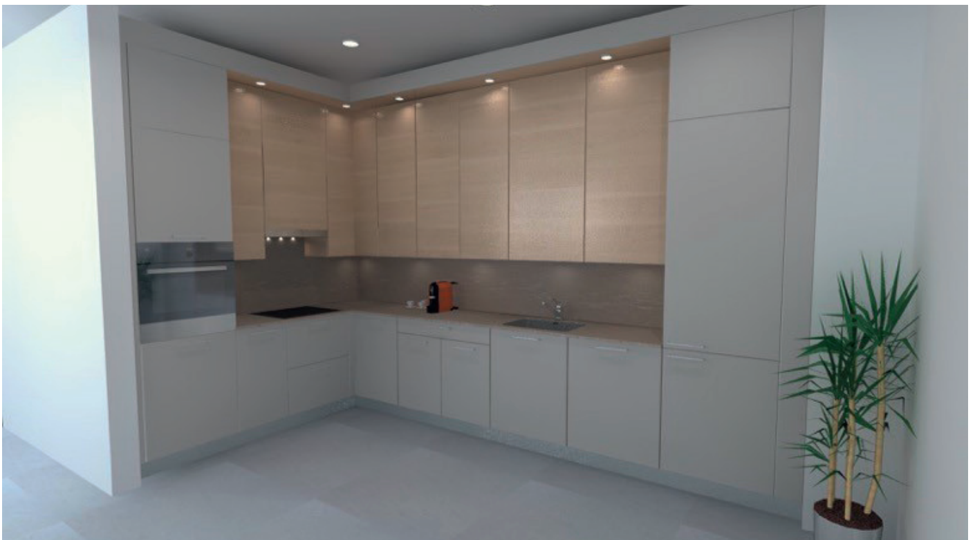
Immeuble D, cuisine