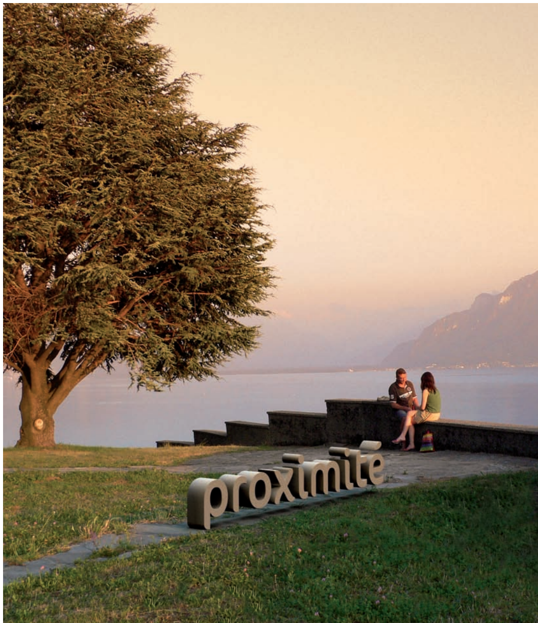
Lac Léman, Les Faverges