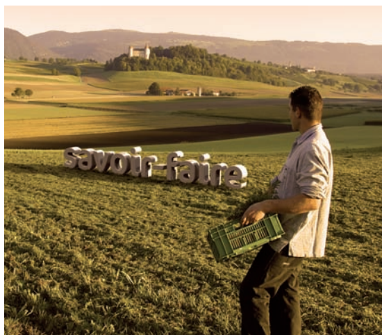
Château de Champvent

Les créances à court terme figurent au bilan pour les sommes effectivement dues à l'institution.